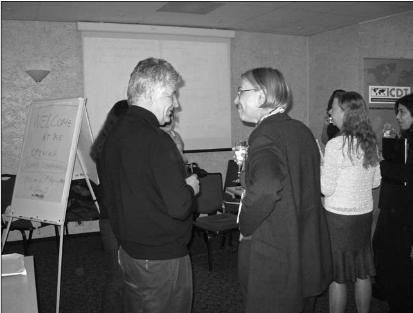
...и виртуальная выставка – фото-слайды на стене ...and the virtual exhibition – a slide-show on the wall