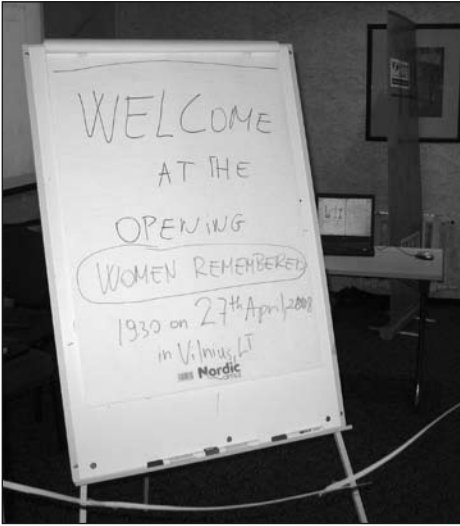
Плакат выставки The billboard of the installation