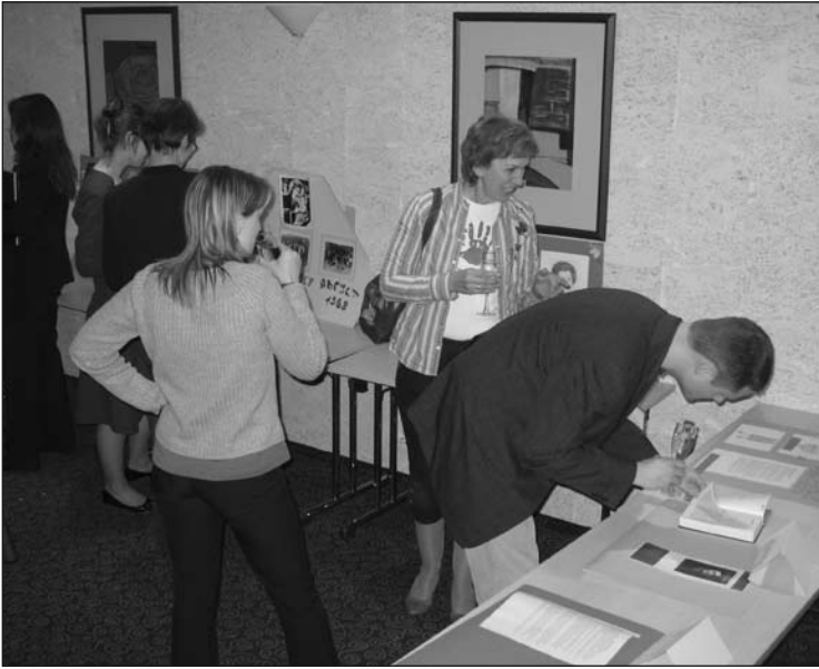
Физические экспонаты на выставке... Exhibition materials to touch...